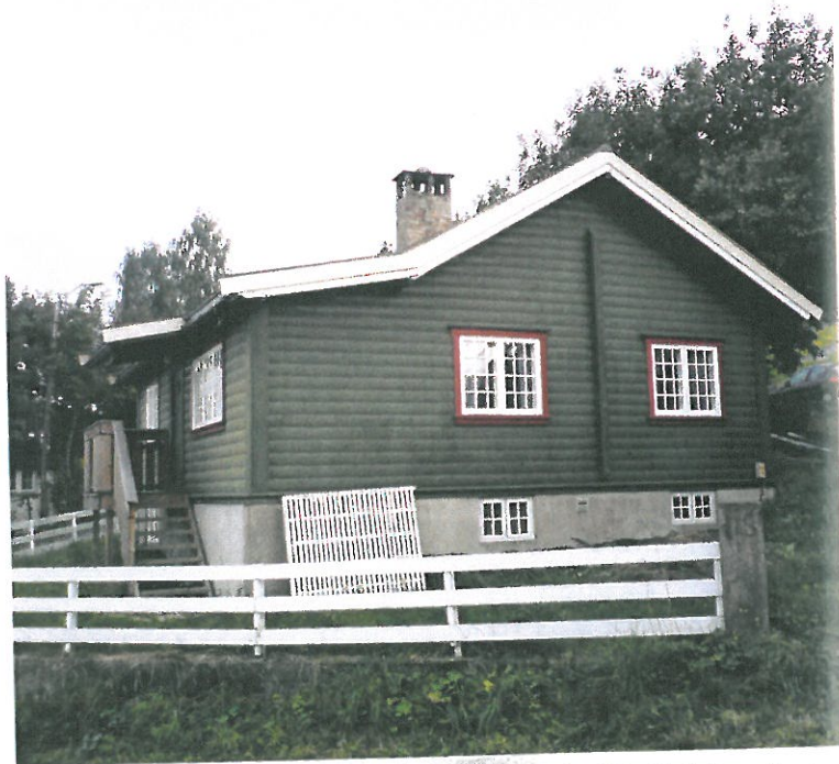
I 1936 kunne speiderne ta i bruk speiderhytta ovenfor Gjøvik skole, ved veien mot Hovdetoppen.