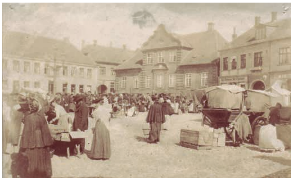
Dette fotografi fra en torvedag på Nytorv i 1880'erne er at finde på Arkiv.dk.