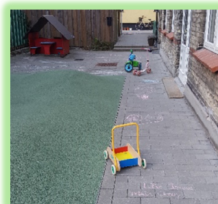
Søndag 22. april kl. 19:45

Sagt med andre ord, hvis poderne ikke selv kan rydde op efter sig, må mor eller far i gang.