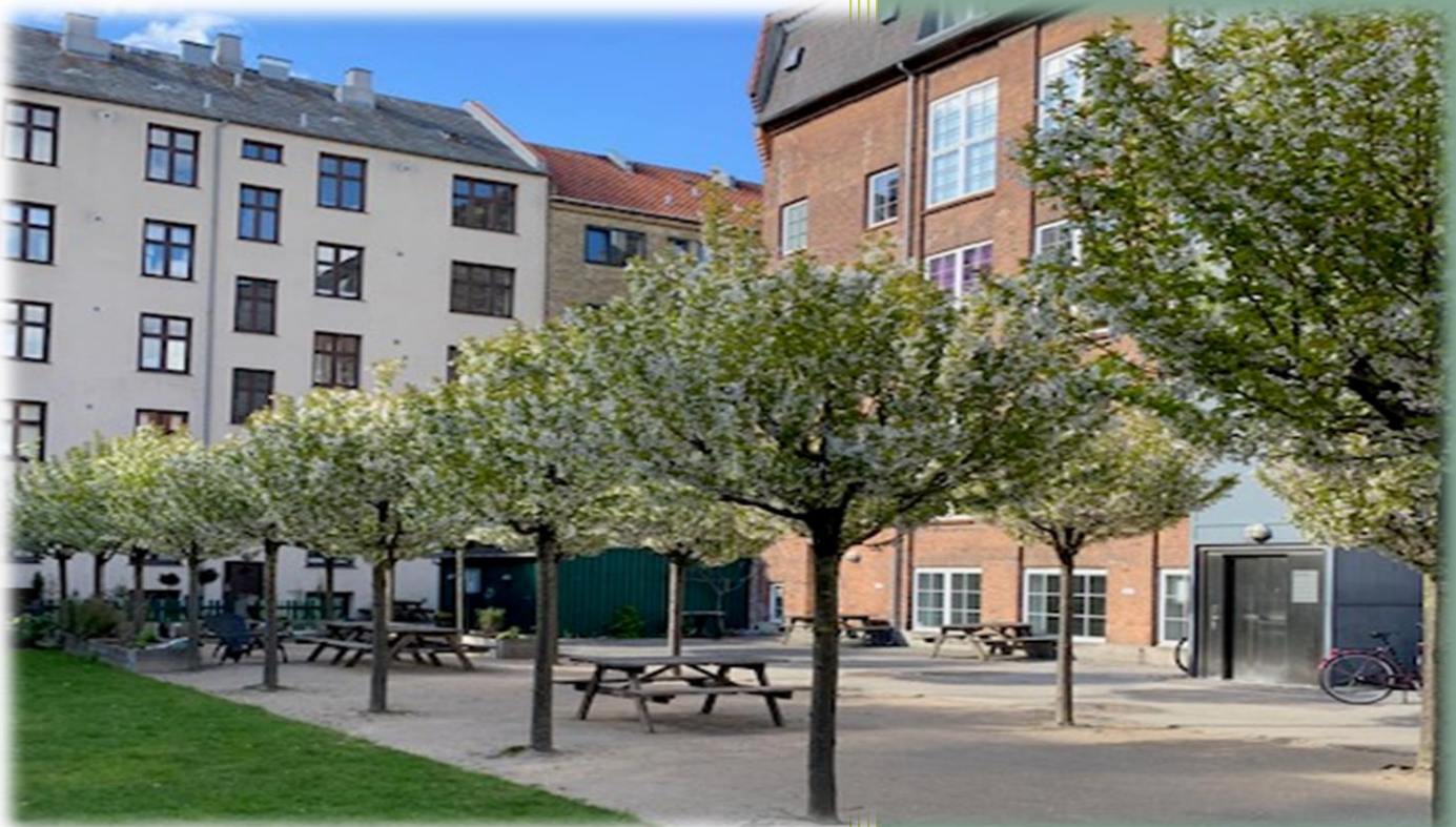
Kirsebærtræerne på Petanquebanen

Beretning findes digitalt på www.glasvej-karreen.dk .