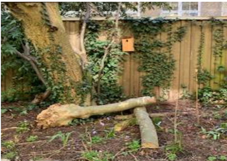
Biodiversitet - AB Thekla

Beretning findes digitalt på www.glasvej-karreen.dk .