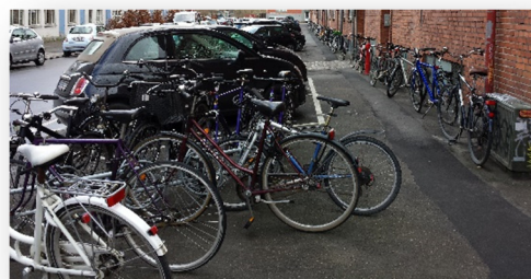
Cykelparkering på Theklavej

For at imødegå det førnævnte problem med fremkommeligheden på fortovet, har bestyrelsen taget kontakt til kommunen for, at høre om mulighederne for etablering af cykelstativer og evt. fjernelse af enkelte bil-parkeringspladser. Der er 5-6 forskellige muligheder for, at opnå de ønskede cykelparkeringspladser.