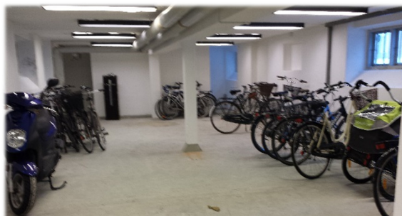
Fælles cykelkælder under terrassen

Cykelparkering skal foretages med sund fornuft og omtanke - i respekt for gården.