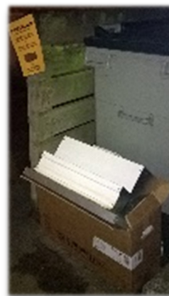
Storskrald sat ved dagrenovation i weekend, hvor der var afhentning af storskrald

Som det kan ses af foto, er det med stor undren det konstateres, at selv når der er opsat gul skilt at der lige nu er container til storskrald, er der beboere, som umotiveret sætter storskrald ved dagrenovationen. Ganske enkelt utroligt, dette er ikke en "viceværtopgave".