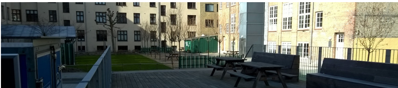
Forårsjævndøgn 22. marts 2015