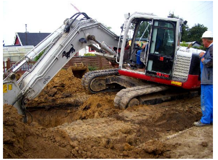
Hov ! her er en forhindring