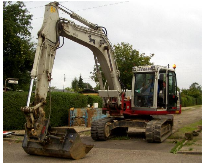
21 august 2008 Kl. 700 så startes der.