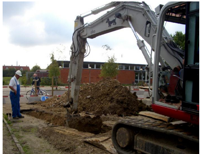
Det første hul graves