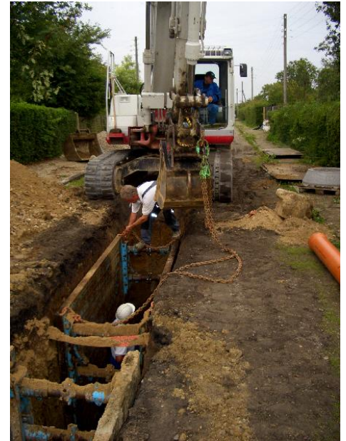
Kæden sættes på