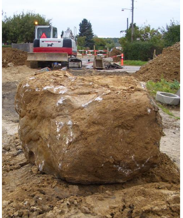
Endnu en stor sten er oppe