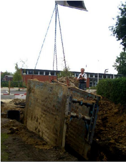
Afstivning trækkes op