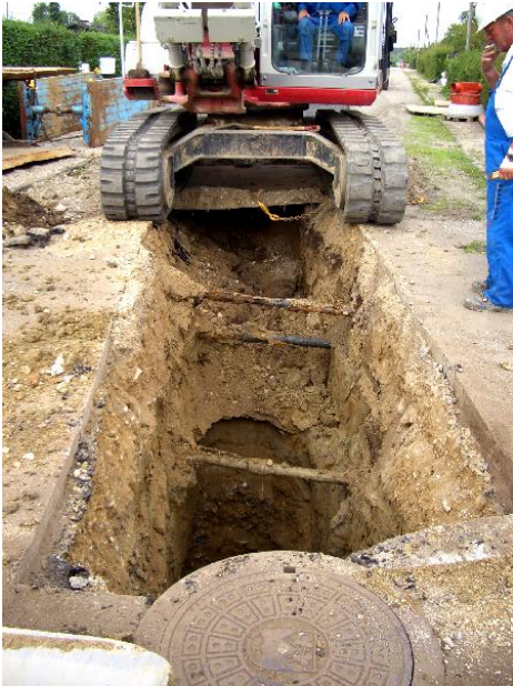
Det første store hul