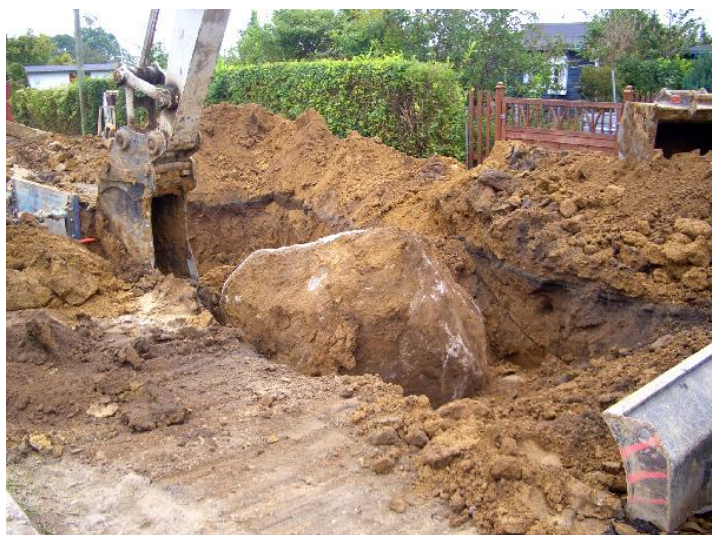
Sten på vej op