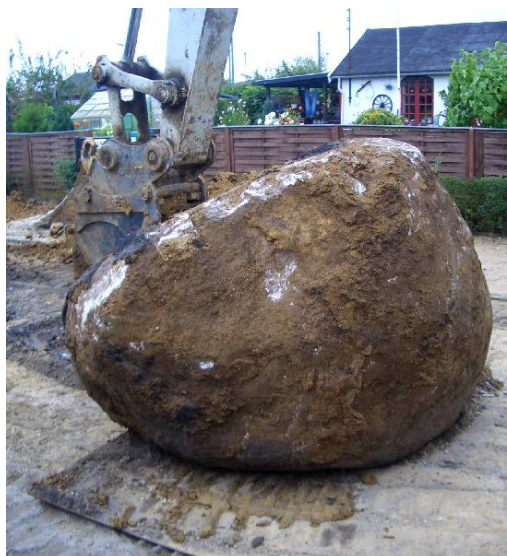
Op kom den, flot arbejde