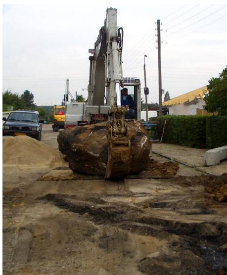
fjernes skal den også