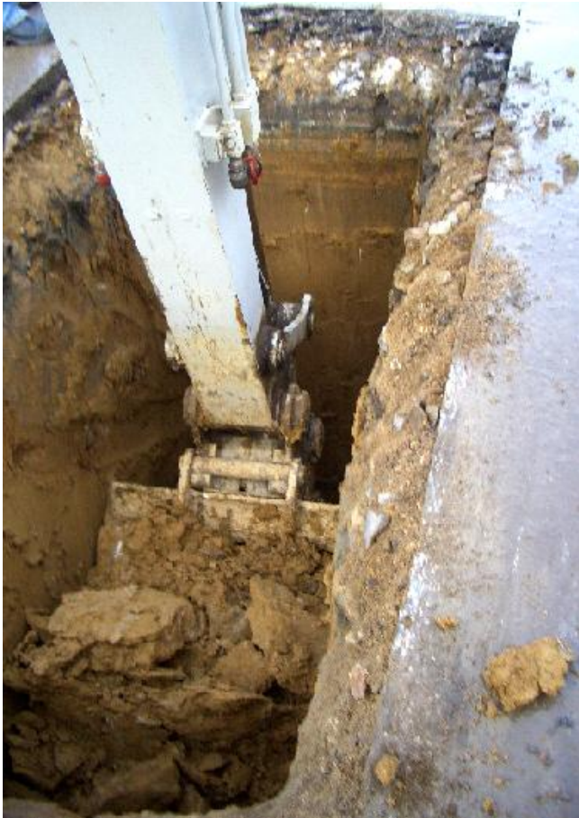
Stenen er altså hernede