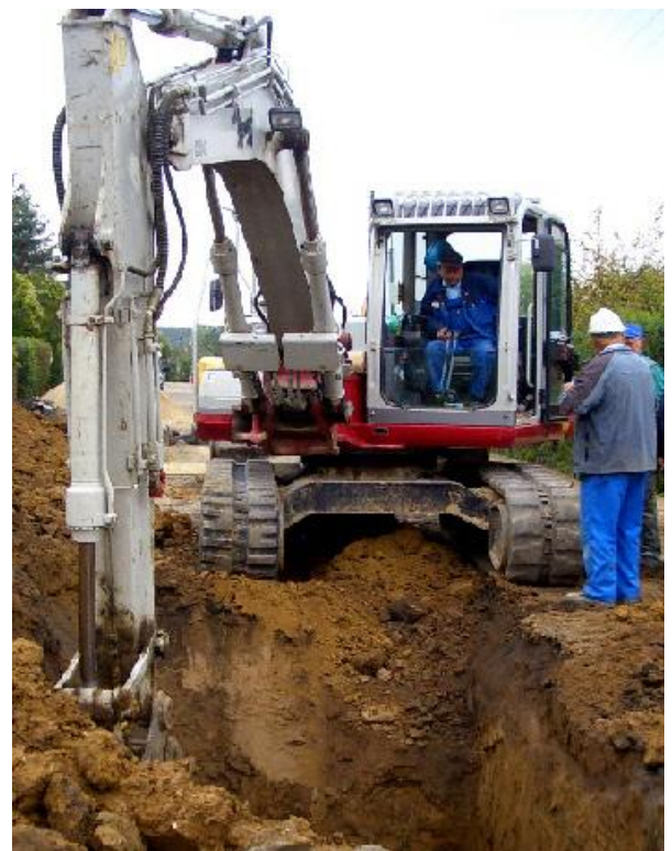
Hvad gør vi nu ??