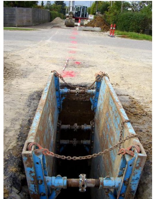
Hullet på hver sin side af Rebæk alle