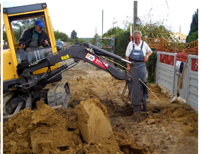
Hullet graves vinkelret fra hovedledning ind til skel