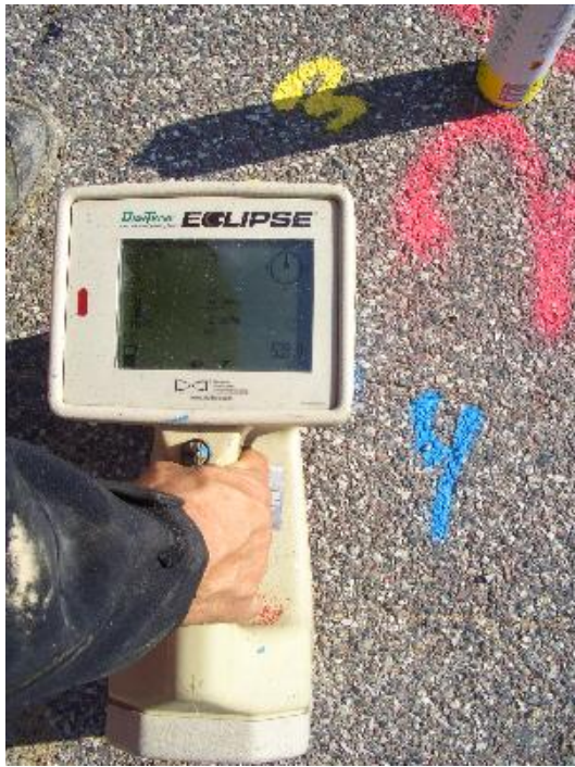
Måling gennem jorden