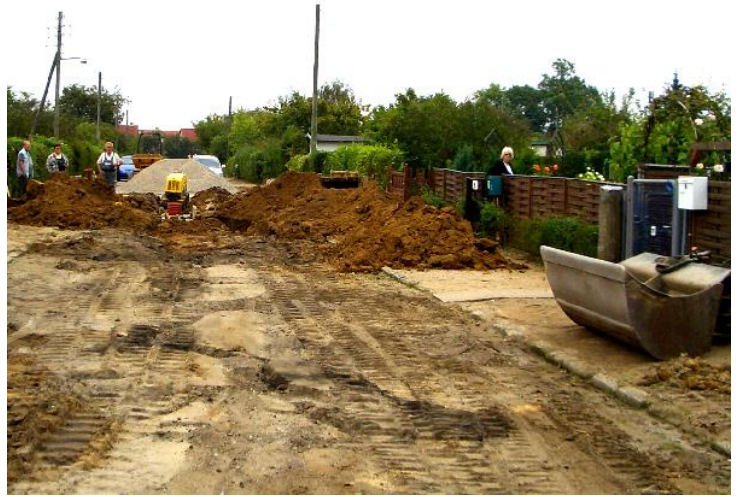
Hullet er lukket