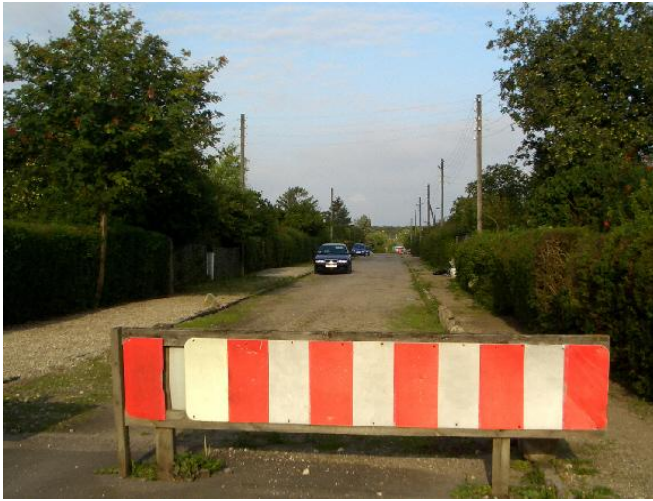
Grustoften 20 august 2008 lukket vej