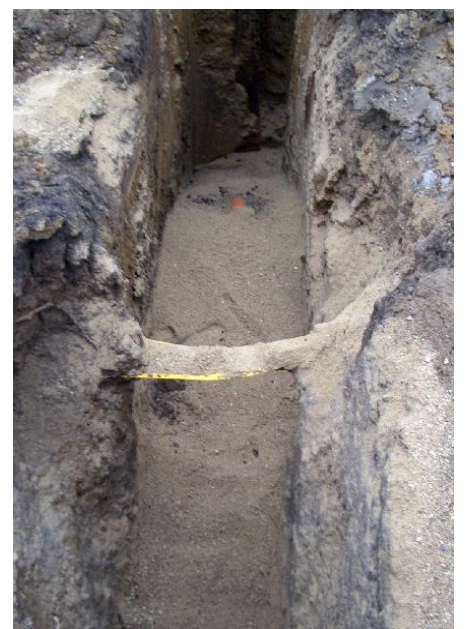
"HULLET" Et epokegørende skridt i Præstemosens historie