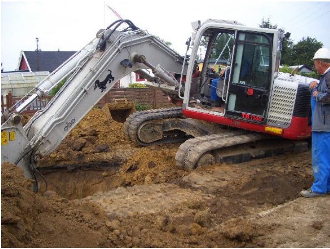
Stort hul lukkes