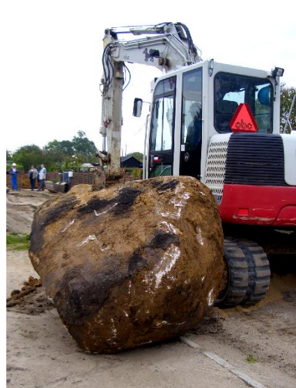
og det blev den