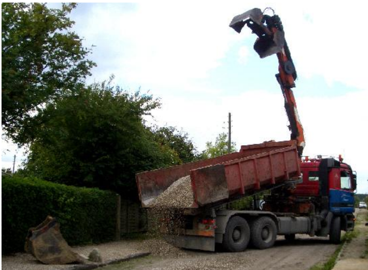
Aflæsning af grus