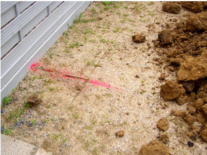
Her skal kloak- og vandledning gå ind i haven