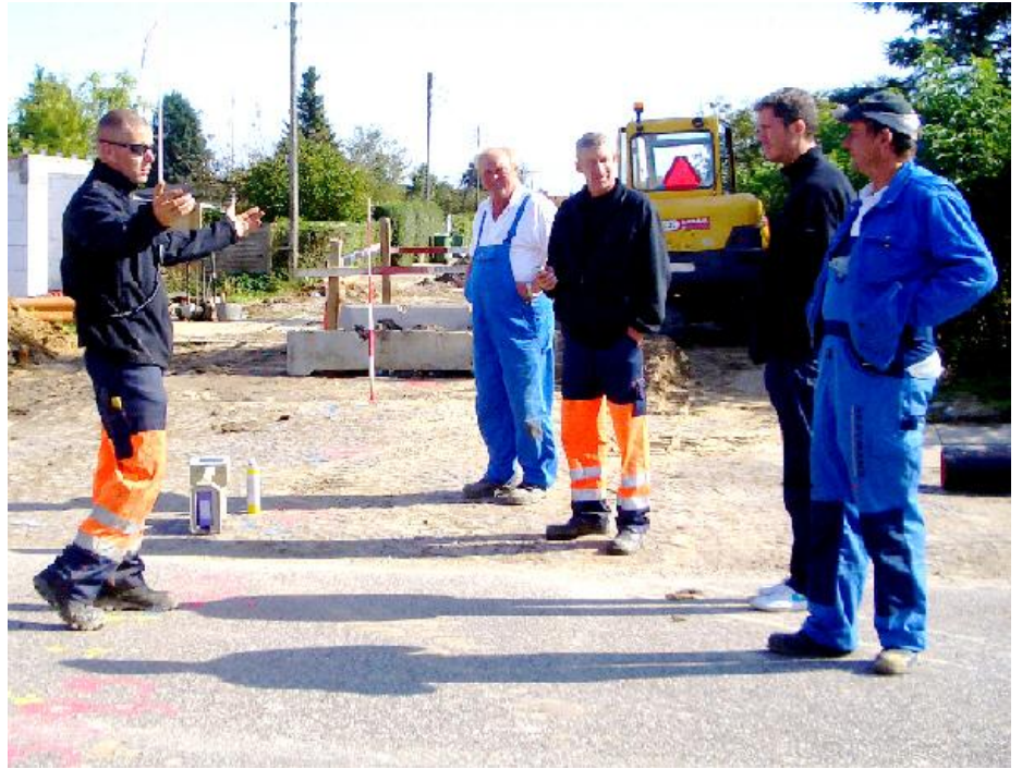
Hvad nu, der er en forhindring, sandsynligvis en stor sten igen.

Desværre , vi er nød til at gå ned gennem asfalten, vi kan ikke komme i gennem med en boring