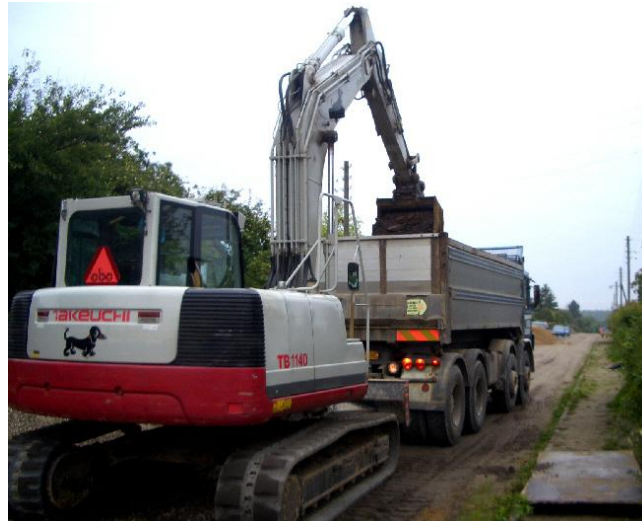
Jord fyldes på og køres væk