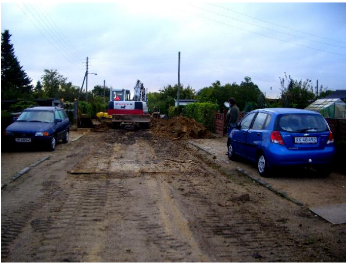
Nu går den altså ikke længere, bilerne SKAL væk