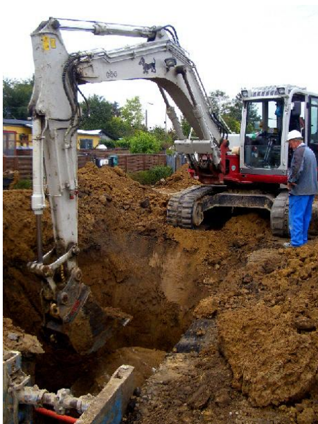
Kan du få den op ?