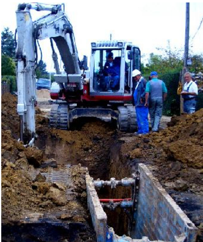
Store problemer !