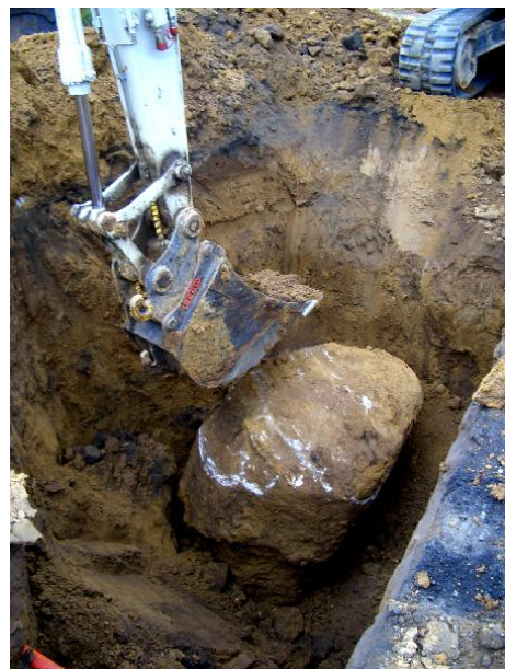
Det SKAL den