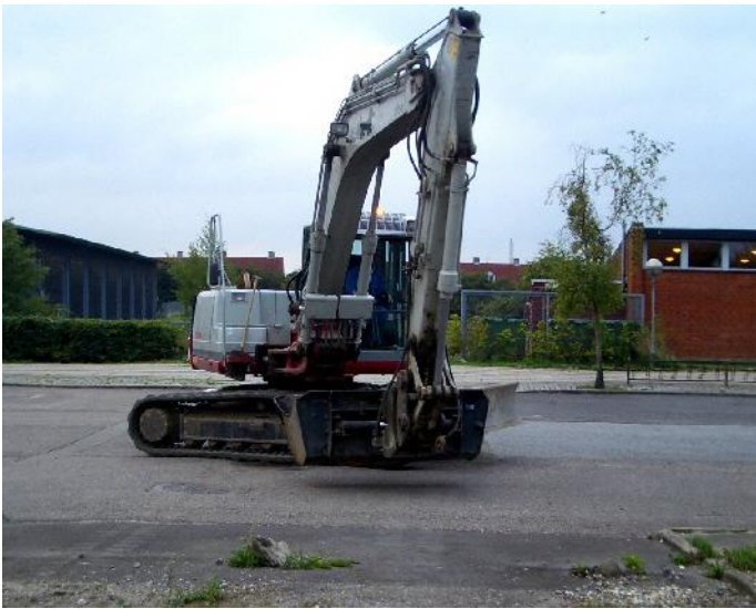
Fri adgang til Grustoften