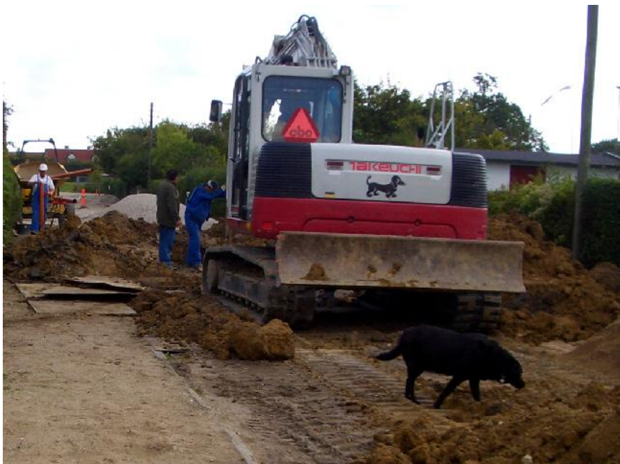
På vej derud ad