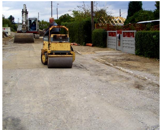
Den "gamle" Grustoften er tilbage igen. Flot arbejde