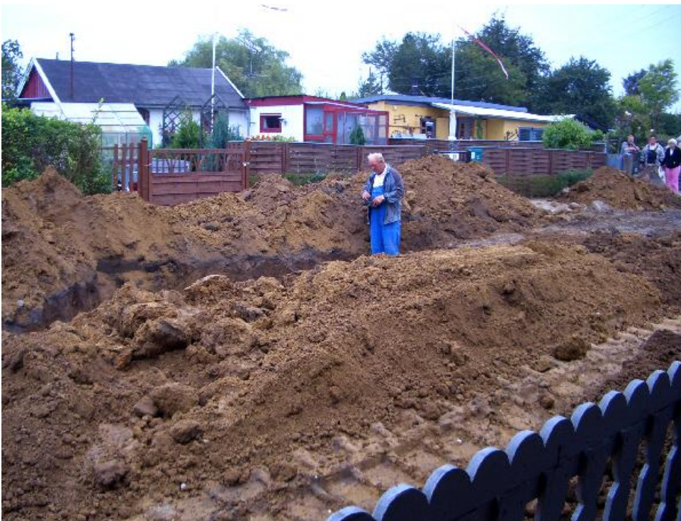
Bliver det her nogen sinde til det "gamle" grustofte igen ?