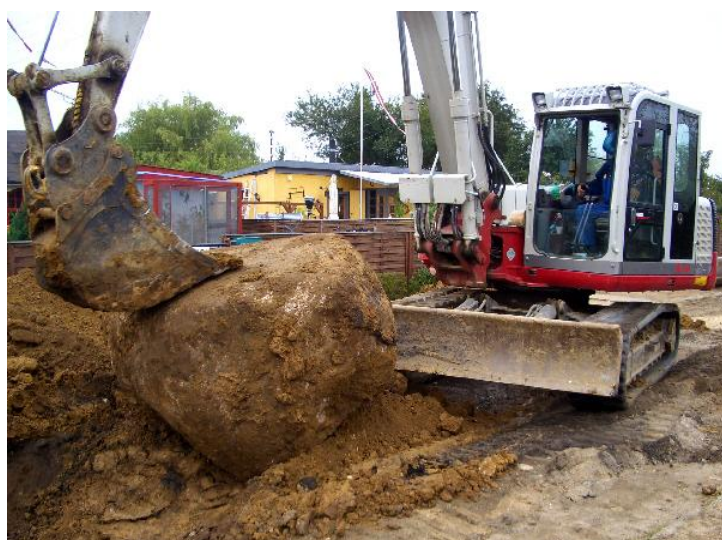
Ihærdighed lønner sig