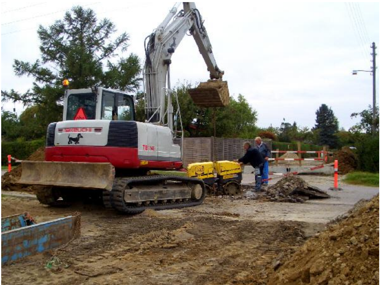
Efter det store arbejde kan man endelig lukke hullet på Rebæk Alle og fortsætte på den anden side af Grustoften.