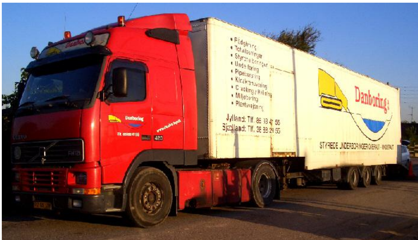
Firmaet der foretog boring under Rebæk Alle