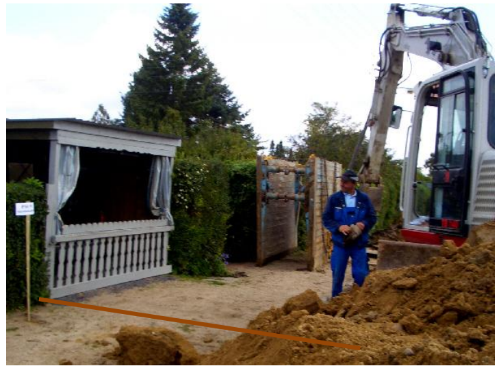
Pas på! her ligger en telefonledning