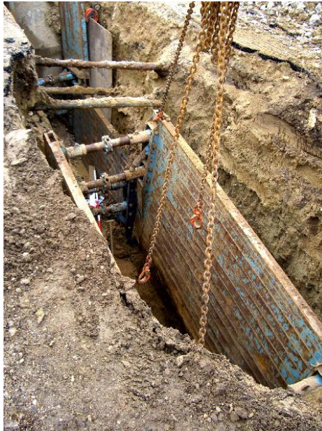
afstivning, undgår jordskred