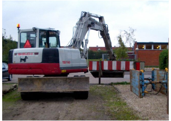
21 aug. Fjernelse af stakit