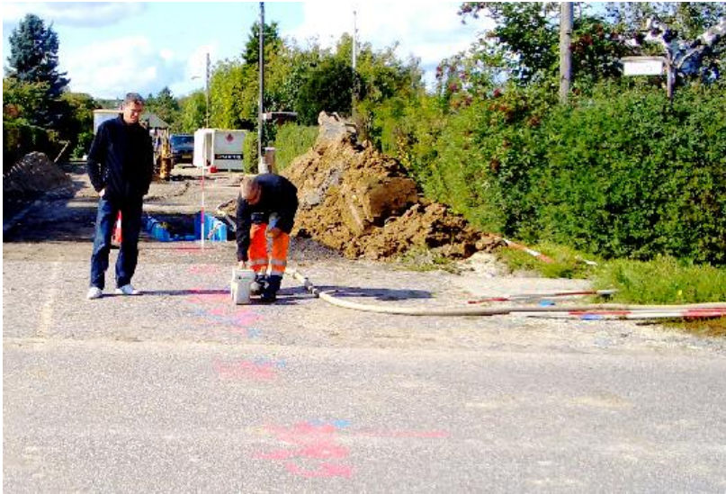
Her skal vi Altså over