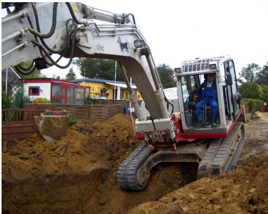
Faretruende ? Næhee, det er vist hverdagskost for gravearbejderne