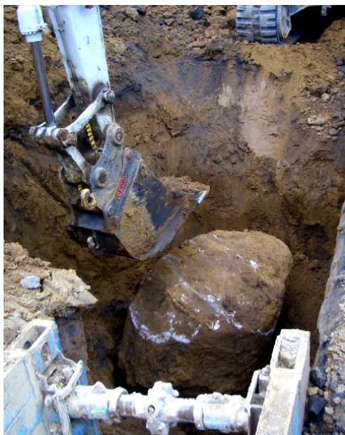
Meget stor sten