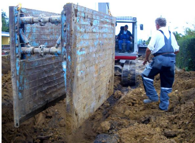
Her den nødvendige afstivning